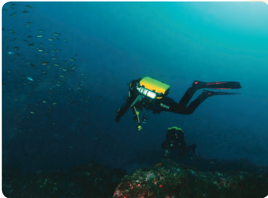
L'usage des recycleurs impose une formation adaptée.

certaines médicaments et l'alcool. Elle est diminuée en milieu sec (caisson hyperbare) et lorsque l'on pratique des "rinçages" : inhalation d'O 2 entrecoupée de périodes de ventilation en mélange normoxique. Mais le facteur le plus important semble être l'hypercapnie, qui aggrave l'hyperoxie.