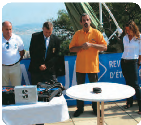
Scubapro et le Vieux Plongeur, parrains historiques !