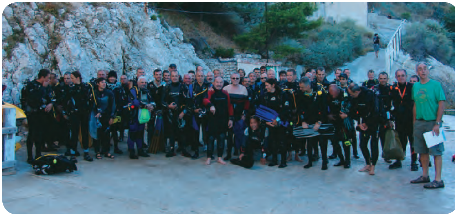
34 candidats réunis pour le meilleur!