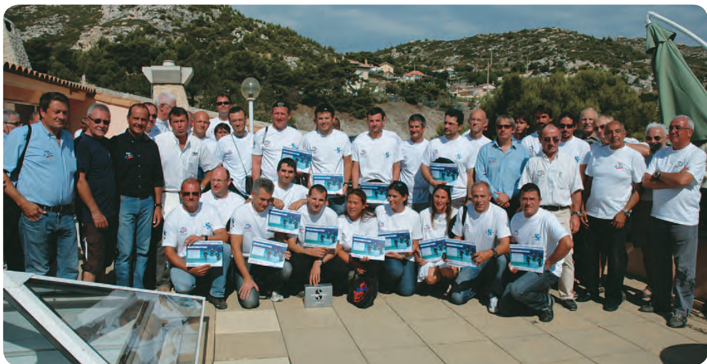
Les 22 lauréats peuvent être satisfaits.